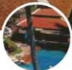
📍 L'hôtel Karon Beach Resort.