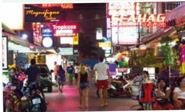
▲ Dans une rue commerçante de Patong, la station balnéaire la plus fréquentée par les touristes occidentaux.