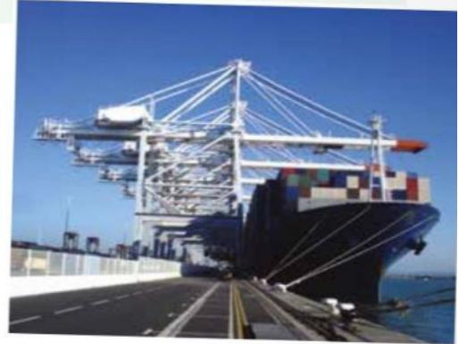
▲ Un navire porte-conteneurs en cours de chargement au Havre.