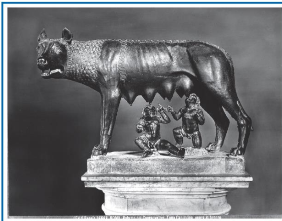
Sculpture en bronze du V e siècle av. J.-C. Rome, Musée del Palazzo dei Conservatori. (Les jumeaux ont été ajoutés au XVI e siècle)

10- Quelle est la nature de l'œuvre ci-dessus ?